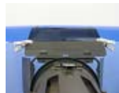
ピンチでライトにフィルターを取り付け

色温度とは 光の色を数値で表したもので単位は K(ケルビン)で表します。温度が高いと青く、低ければ赤く見える。タングステンライトは 3000° K ~ 3200° K。蛍光灯は 4000° K ~ 4500° K。太陽光は 5500° K ~ 6500° K とされています。